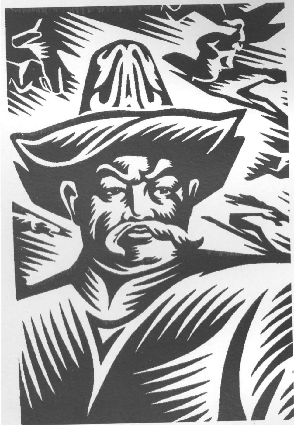
Б.Джумабаев. С.Каралаевдин портрета. Цинкогр. 1965.