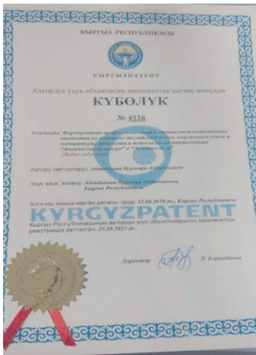
1-сүрөт. Дене тарбия, спорт, медицина багытындагы адистерди даярдоонун кесиптик компетенттүүлүгүн калыптандыруу