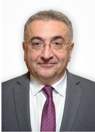
Азизян А. Ф.,

вице-президент Евразийского патентного ведомства