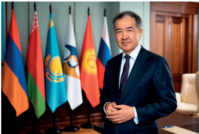
Сагинтаев Б. А.,

член Коллегии (Министр) по экономике и финансовой политике Евразийской экономической комиссии